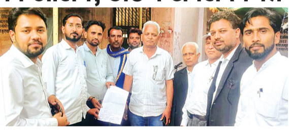
हरिभूमि न्यूज | ललितपुर

जिले में स्मार्ट मीटर के माध्यम से गलत विद्युत बिल जारी किए जाने से परेशान उपभोक्ताओं ने जिलाधिकारी से शिकायत कर समस्या के समाधान की मांग की है। उपभोक्ताओं का आरोप है कि विद्युत विभाग द्वारा लगाए गए स्मार्ट मीटरों से अत्यधिक बिलिंग की जा रही है, जिससे आम जनता को आर्थिक और मानसिक परेशानी झेलनी पड़ रही है। शिकायत में बताया गया कि स्मार्ट मीटर लगाते समय विभागीय कर्मचारियों ने उपभोक्ताओं को भरोसा दिलाया था कि उन्हें केवल उपयोग की गई बिजली के अनुसार ही बिल देना होगा और किसी प्रकार की त्रुटि नहीं होगी। लेकिन वर्तमान में कई उपभोक्ताओं को बढ़ा-चढ़ाकर बिल भेजे जा रहे हैं, जिनकी जानकारी उन्हें बिजली सप्लाई कटने के बाद होती है। उपभोक्ताओं का कहना है कि गलत बिल के बावजूद उनसे अग्रिम धनराशि जमा कराई जा रही है और पूरा भुगतान होने के बाद ही बिजली आपूर्ति बहाल की जाती है। इस कारण लोग रोजाना विभागीय कार्यालयों के चक्कर लगाने को मजबूर हैं, जबकि कर्मचारियों द्वारा समस्या को टालने का आरोप भी लगाया गया है। शिकायतकर्ताओं ने जिलाधिकारी से मांग की है कि गलत बिलिंग के लिए जिम्मेदार कर्मचारियों के खिलाफ कार्रवाई की जाए तथा समस्या का जल्द समाधान कराया जाए। साथ ही यह भी मांग की गई है।